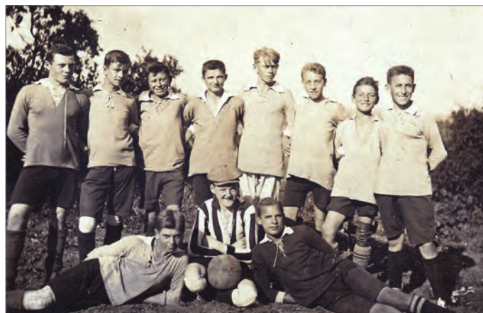
2. Mannschaft 1922