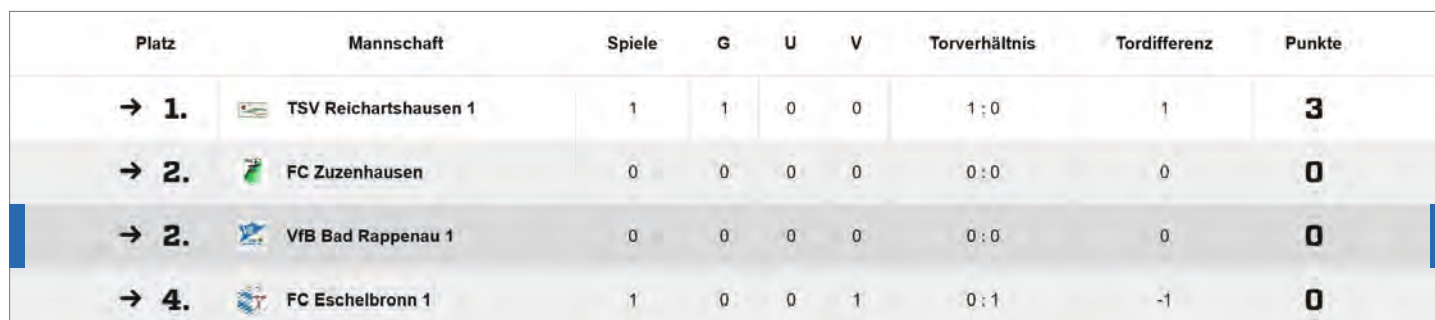
TABELLE E-JUGEND 2